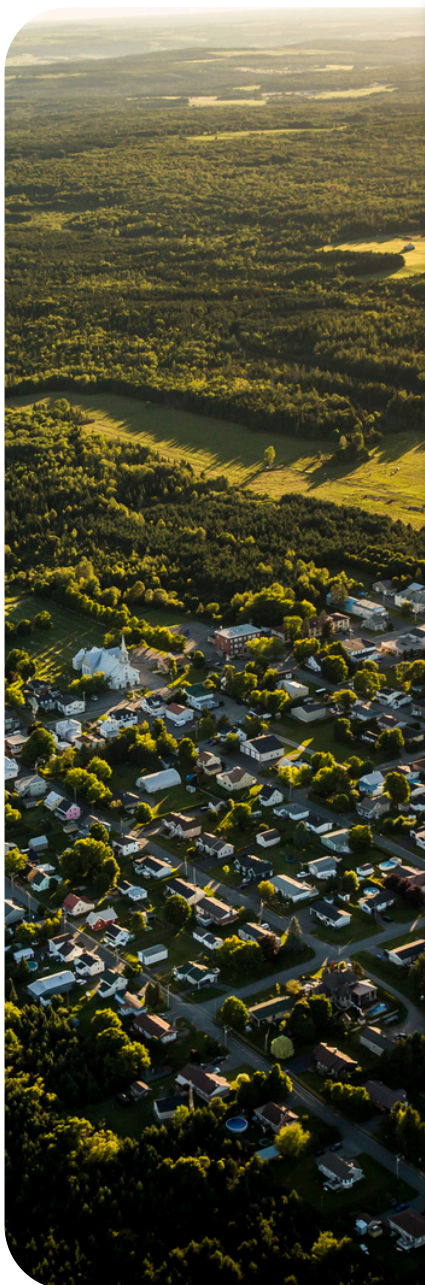
Municipalité de Frampton

Le territoire de la MRC de La Nouvelle-Beauce se distingue par un contexte territorial particulier. D'une part, sa superficie est relativement restreinte, avec 905 km 2 répartis entre 11 municipalités. D'autre part, la quasi-totalité de ce territoire, soit 95 %, est située en zone agricole. Cette spécificité constitue un défi majeur d'aménagement, particulièrement en contexte périurbain, où les enjeux de gestion de l'urbanisation et la pression au développement se trouvent accentués.