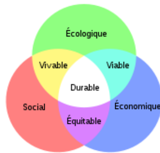
Figure 1 : Modèle de Jacob et Sadler : Conception à 3 dimensions égalitaires 2

C'est le fondement de la compréhension et de la vision du DD d'un acteur. C'est une construction abstraite qui peut être illustrée par un modèle statique ou dynamique. Elle se définit par le nombre (habituellement de 2 à 5) et la nature des dimensions considérées (sociale, écologique, économique, éthique, culturelle, territoriale, de gouvernance, etc.) ainsi que par les relations entre ces dimensions (égalité, hiérarchisation, subordination...).