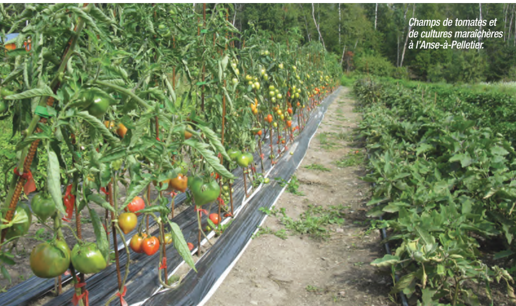
Champs de tomates et de cultures maraîchères à l'Anse-à-Pelletier.