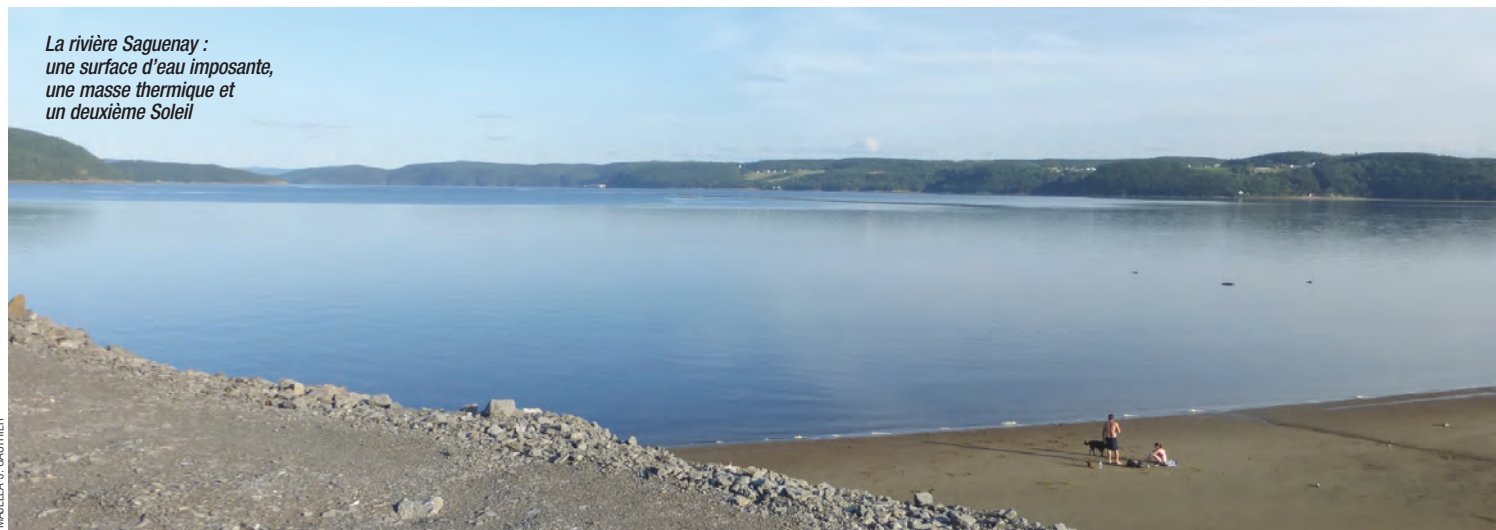
La rivière Saguenay : une surface d'eau imposante, une masse thermique et un deuxième Soleil

L'étude devrait être utile aux agriculteurs résidant sur le territoire, aux autorités qui ont la mission de planifier le développement rural et aussi à tous ceux et