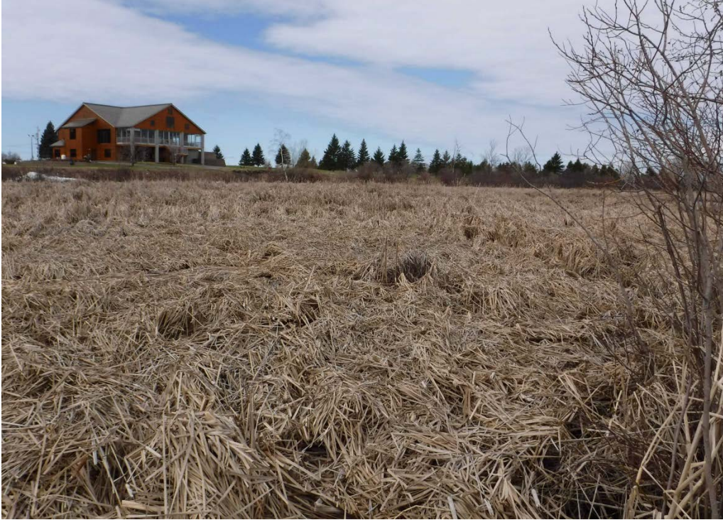
Figure 19 : Marais du Golf de Saint-Prime. La photographie a été prise à partir du seuil du marais. Latitude : 48,60591 N; Longitude : 72,33534 O. Niveau du lac : 13,85 pi.