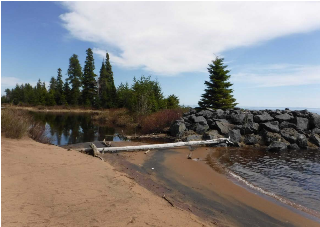
Figure 39 : Embouchure du lac à la tortue. La vue est en direction de l'habitat. Latitude : 48,67617 N; Longitude : 72,98181 O. Niveau du lac : 16,50 pi.