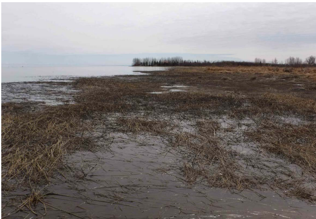
Figure 23 : Habitat situé dans le secteur de la baie Allard et de la baie des Castors. La vue est en direction est. Latitude : 48,68010 N; Longitude : 72,34772 O. Niveau du lac : 13,98 pi.