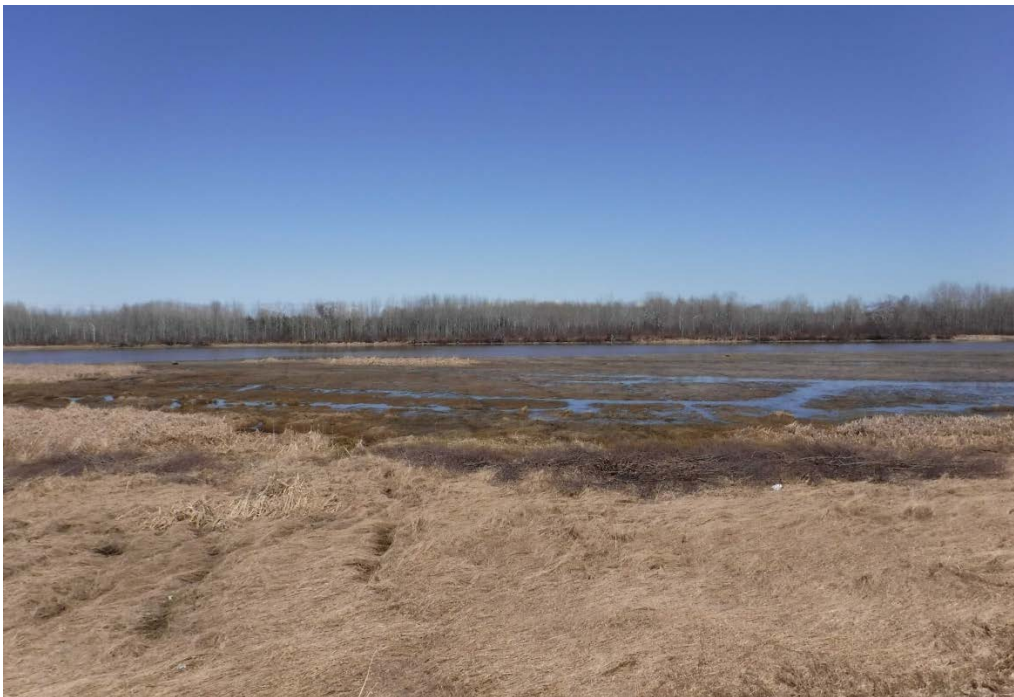
Figure 22 : Habitat retrouvé dans la rivière Ticouapé à environ 2 km de son embouchure. Latitude : 48,69818 N; Longitude : 72,37902 O. Niveau du lac : 14,00 pi.