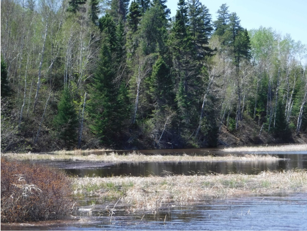
Figure 33 : Exemple d'herbiers retrouvés près de l'embouchure de la Petite rivière Péribonka. Latitude : 48,76916 N; Longitude : 72,10231 O. Niveau du lac : 16,5 pi.

Les habitats présentent un potentiel « moyen » pour la reproduction des poissons. Ils sont de faible superficie et les herbiers y sont relativement peu abondants. Ceux-ci offrent néanmoins un substrat de fraie intéressant pour le grand brochet et la perchaude.