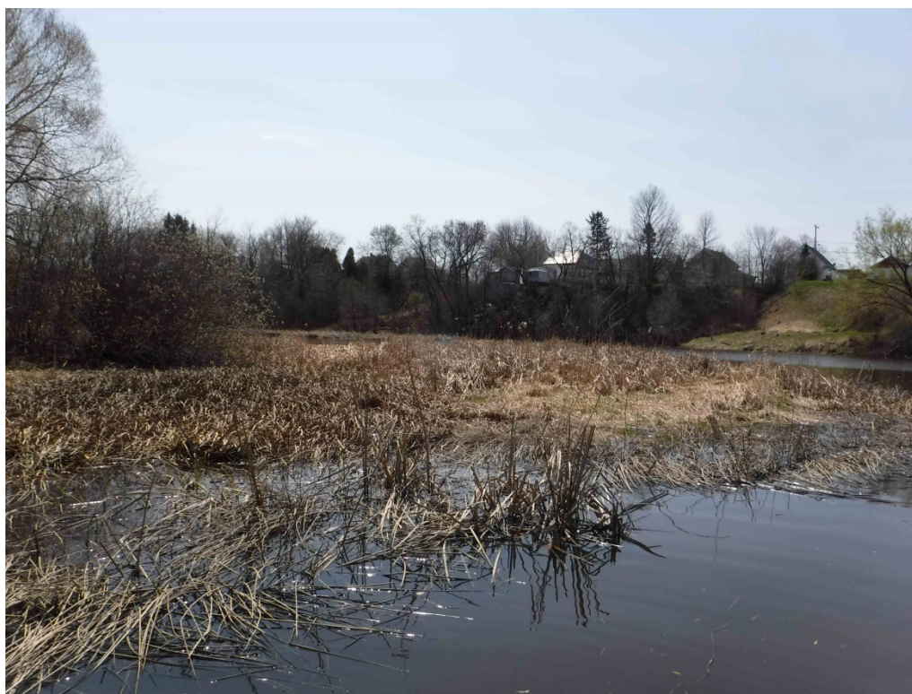
Figure 11 : Herbier typique de la rivière Couchepaganiche. Latitude : 48,43064 N; Longitude : 71,86898 O. Niveau du lac : 15,36 pi.

Le potentiel de fraie pour les poissons dans la rivière Couchepaganiche est considéré comme « moyen », malgré la faible superficie de l'habitat. Bien que les herbiers soient nombreux, plusieurs secteurs du littoral en sont dépourvus et leur forte densité limite