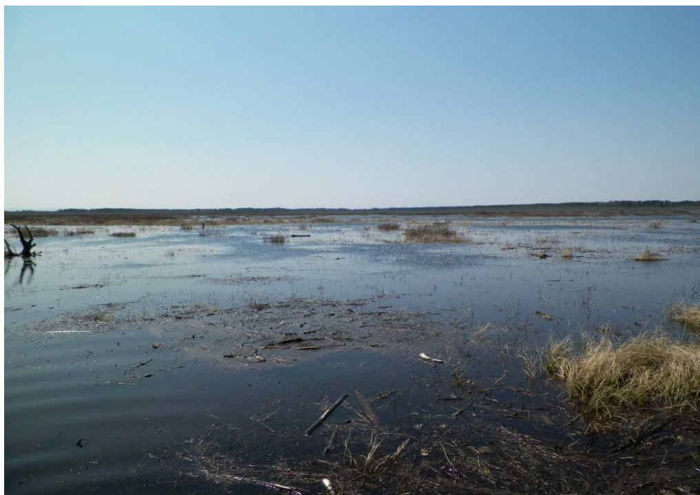
Figure 32 : Débris et herbiers dans la baie Ptarmigan. Niveau du lac : 16,44 pi.