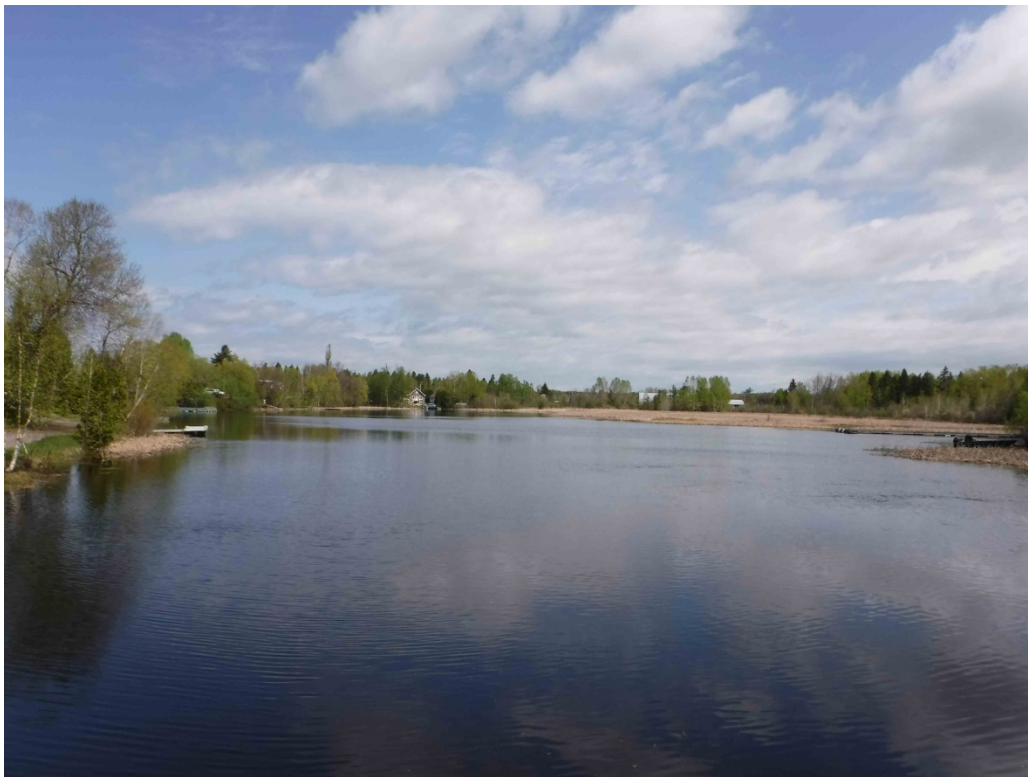
Figure 3 : Étang des Îles. La vue est à partir du ponceau, en direction nord. Latitude : 48,51812 N; Longitude : 71,77506 O. Niveau du lac : 16,34 pi.

La faible diversité des herbiers de l'étang des Îles, qui sont dominés principalement par les typhas et sa faible superficie font en sorte que le potentiel de fraie de l'habitat est classé comme étant « moyen ». Néanmoins, la végétation et les billes de bois retrouvées