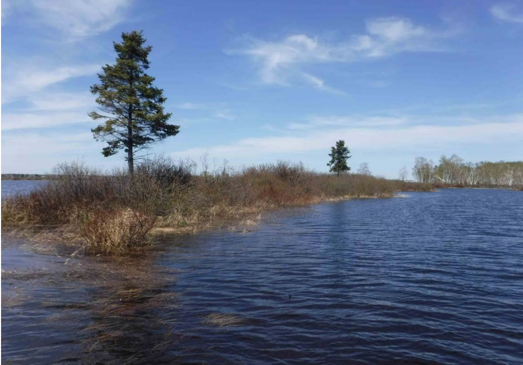
Figure 34 : Habitats retrouvés entre les îles de la rivière Péribonka et la Pointe-Taillon. Latitude : 48,74589 N; Longitude : 72,06909 O. Niveau du lac : 16,50 pi.