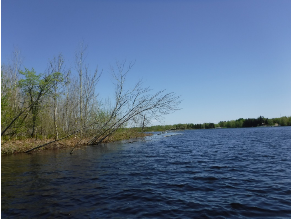
Figure 21 : Érosion dans le secteur des îles Hudon. Latitude : 48,64452 N; 72,40622 O. Niveau du lac : 16,27 pi.

Bien que ce milieu humide soit loin du lac Saint-Jean, il en demeure un habitat à « fort » potentiel pour les poissons de la rivière Ashuapmushuan. Tout comme les autres milieux humides situés dans des rivières, les habitats des îles Hudon semblent se réchauffer moins rapidement que les marais. Ainsi, lorsque la crue du lac vient inonder les herbiers, leur température est possiblement encore adéquate pour la fraie.