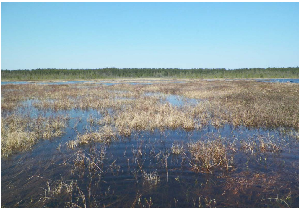
Figure 31 : Herbiers typiques dans la baie Ptarmigan. Niveau du lac : 16,44 pi.