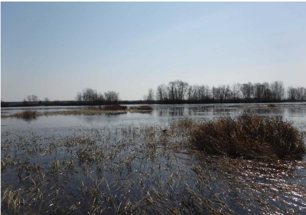
Figure 28 : Herbiers typiques retrouvés le long du canal du Cheval. Latitude : 48,73083 N; Longitude : 72,34656 O. Niveau du lac : 16,44 pi.