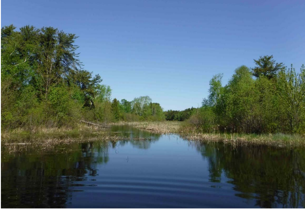
Figure 16 : Partie centrale des habitats retrouvés dans la baie Doré. Latitude : 48,45577 N; Longitude : 72,11011 O. Niveau du lac : 16,27 pi.