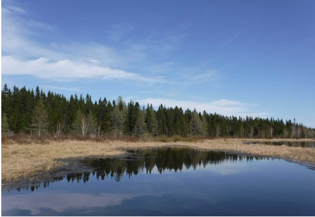
Figure 40 : Herbier de la rivière Taillon, bras sud-est. Latitude : 48,67661 N; Longitude : 72,86757 O. Niveau du lac : 16,50 pi.