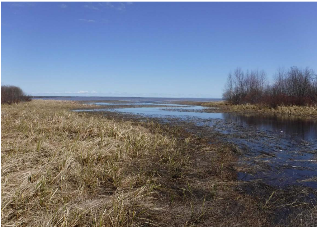
Figure 24 : Habitat situé à l'embouchure du ruisseau Girard. La vue est en direction du lac. Latitude : 48,68738 N; Longitude : 72,36063 O. Niveau du lac : 13,98 pi.