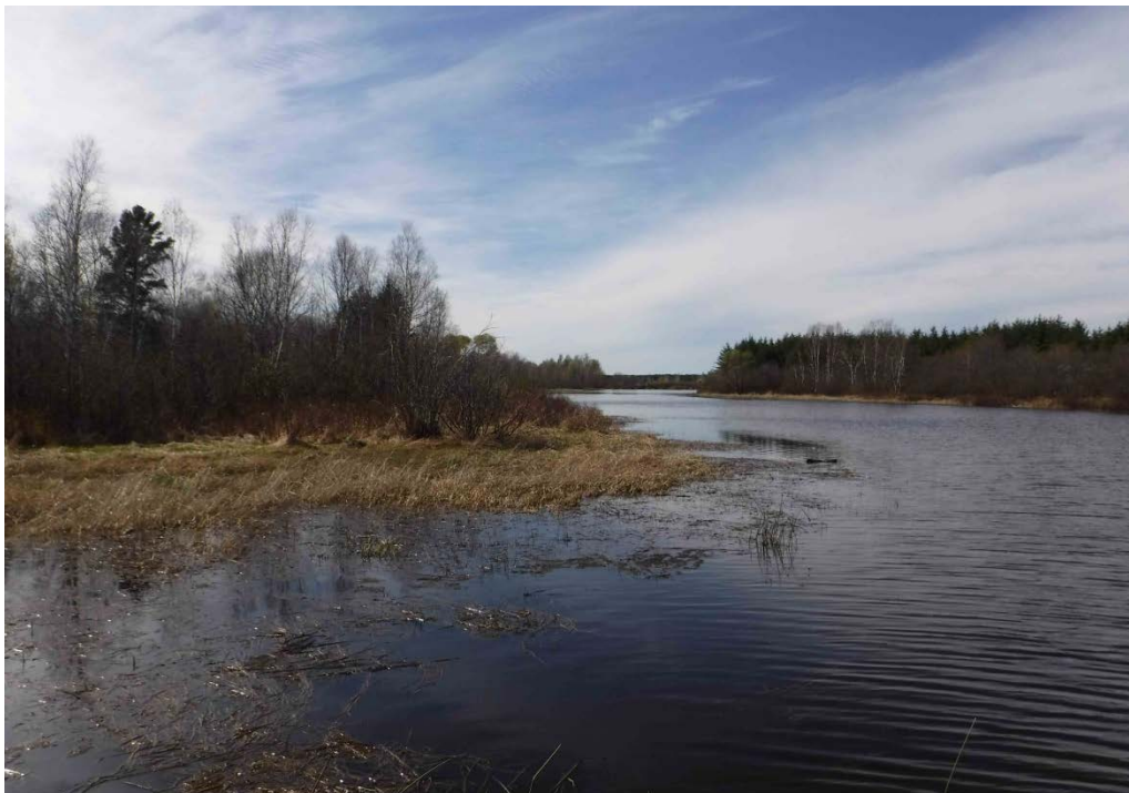
Figure 41 : Herbier de la rivière Taillon, bras nord-ouest. Latitude : 48,67803 N; Longitude : 72,86800 O. Niveau du lac : 16,50 pi.