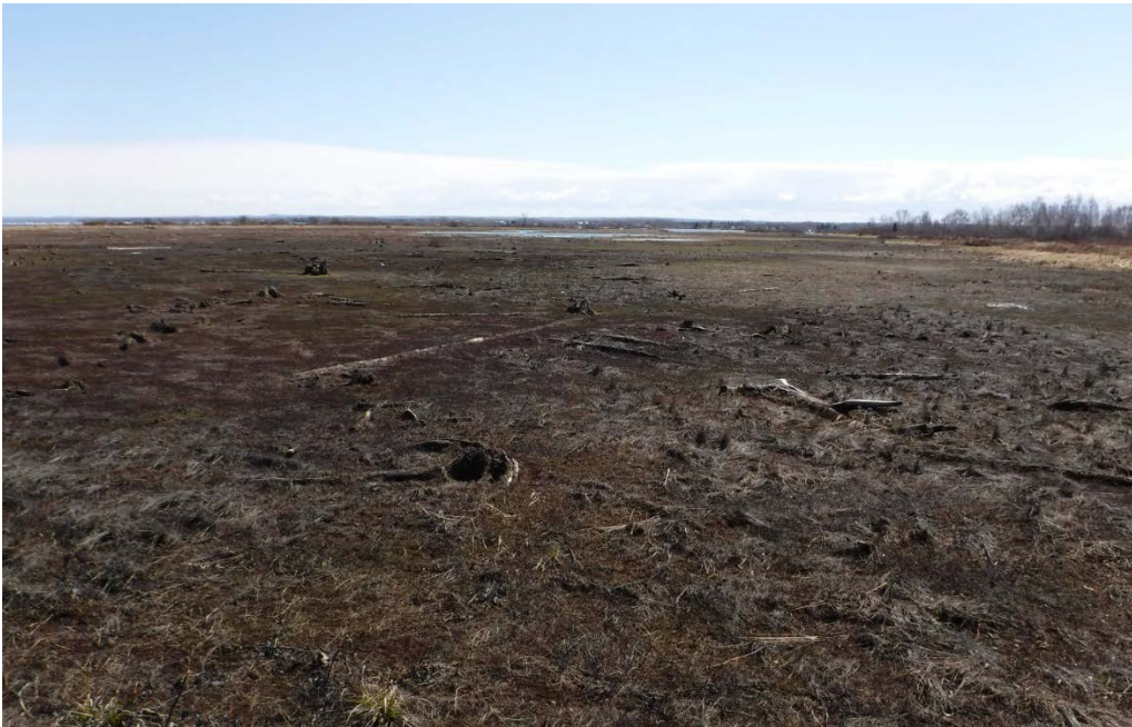
Figure 26 : Habitat situé sur le côté est de la pointe aux Pins, près de l'embouchure de la rivière Ticouapé. Latitude : 48,70073 N; Longitude : 72,34629 O. Niveau du lac : 14 pi.