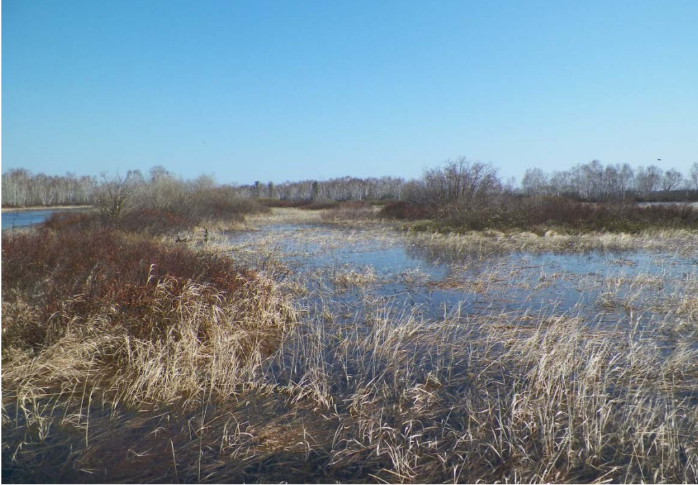
Figure 27 : Herbiers typiques retrouvés dans une baie le long du canal du Cheval. Latitude : 48,73075 N; Longitude : 72,34675 O. Niveau du lac : 16,44 pi.