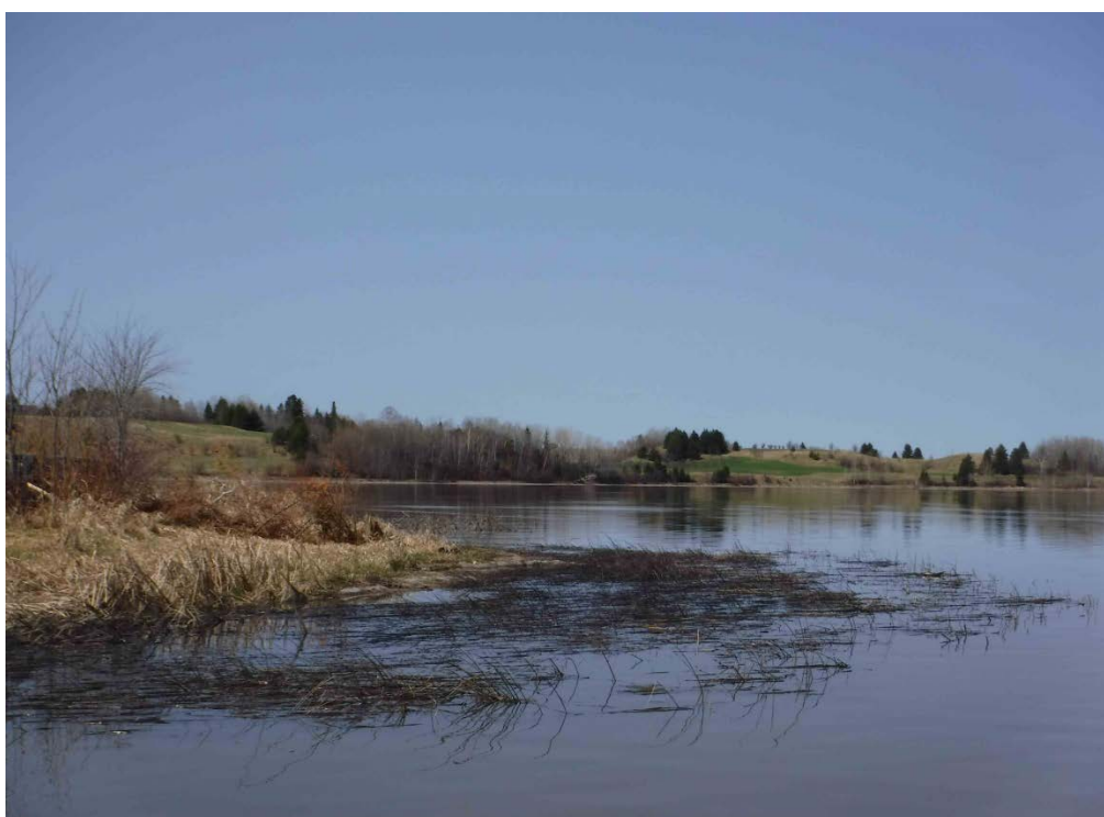
Figure 8 : Grand marais de Métabetchouan, herbiers qui bordent la rive sud. Latitude : 48,45967 N; Longitude : 71,79531 O. Niveau du lac : 15,30 pi.