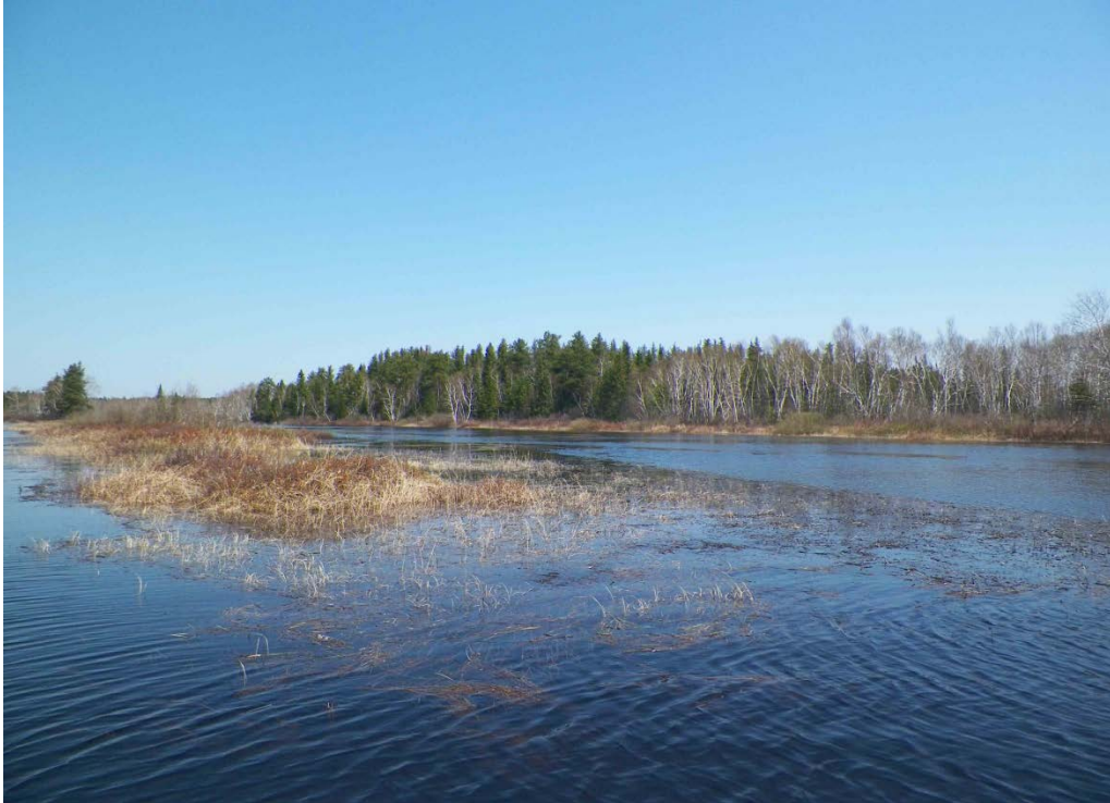
Figure 29 : Habitats herbeux entre les îles de la rivière Mistassini. Niveau du lac : 16,44 pi.