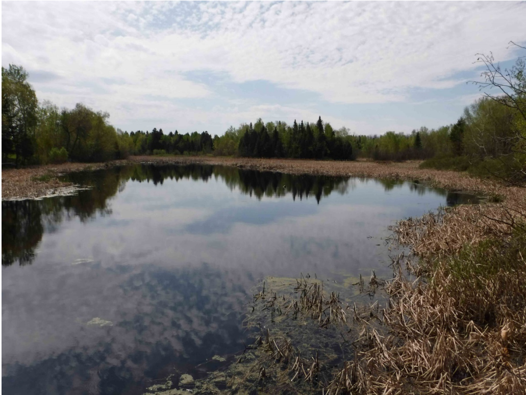
Figure 4 : Étang des Îles. La vue est en direction sud. Latitude : 48,51715 N; Longitude : 71,77544 O. Niveau du lac : 16,34 pi.

dans les secteurs plus profonds et l'excellente accessibilité très tôt au printemps font en sorte que l'étang des Îles représente un habitat intéressant pour la fraie hâtive.