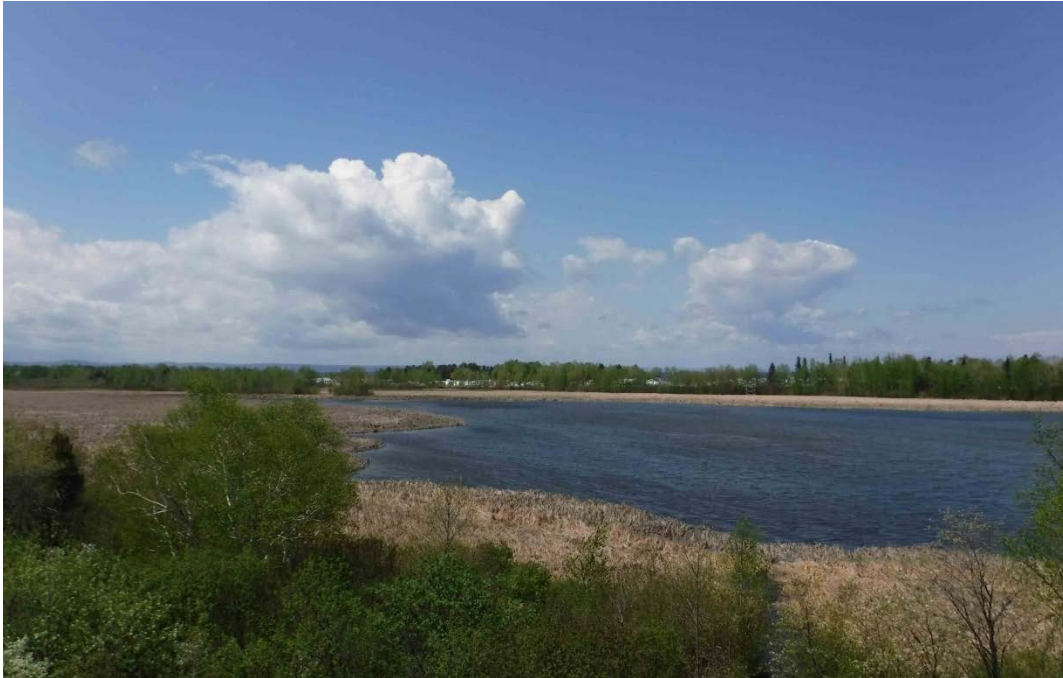
Figure 5 : Petit marais de Saint-Gédéon, partie sud. Les herbiers présents le long du rivage sont majoritairement des typhas. Latitude : 48,49757 N; Longitude : 71,77880 O. Niveau du lac : 16,30 pi.