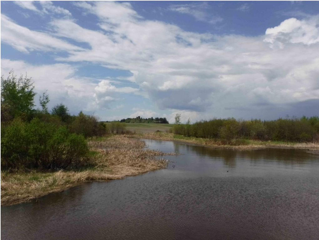
Figure 42 : Habitat retrouvé dans la partie ouest de la baie de la Pipe. Latitude : 48,65355 N; Longitude : 72,82804 O. Niveau du lac : 16,30 pi.

La baie de la Pipe a été visitée à une reprise le 26 mai. Le niveau du lac était de 16,30 pi et la température de l'habitat en surface était de 18,5 °C. La végétation est dominée par les typhas, les graminées et les cypéracées. On retrouve peu de végétation émergente sous le niveau de 14 pi. Les herbiers étaient accessibles pour les poissons lors de notre visite.