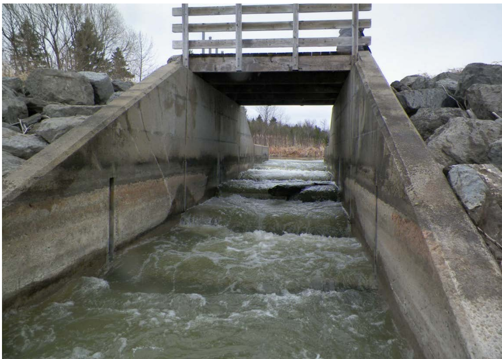
Figure 10 : Structure de maintien du niveau de l'eau du marais Le Rigolet. La vue est en direction du marais. Latitude : 48,43690 N; Longitude : 71,86293 O. Niveau du lac : 12,80 pi.