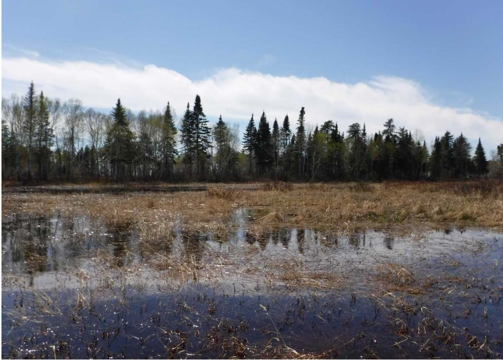
Figure 36 : Herbiers retrouvés dans le secteur de l'ancien lac Askeen. Niveau du lac : 16,50 pi.