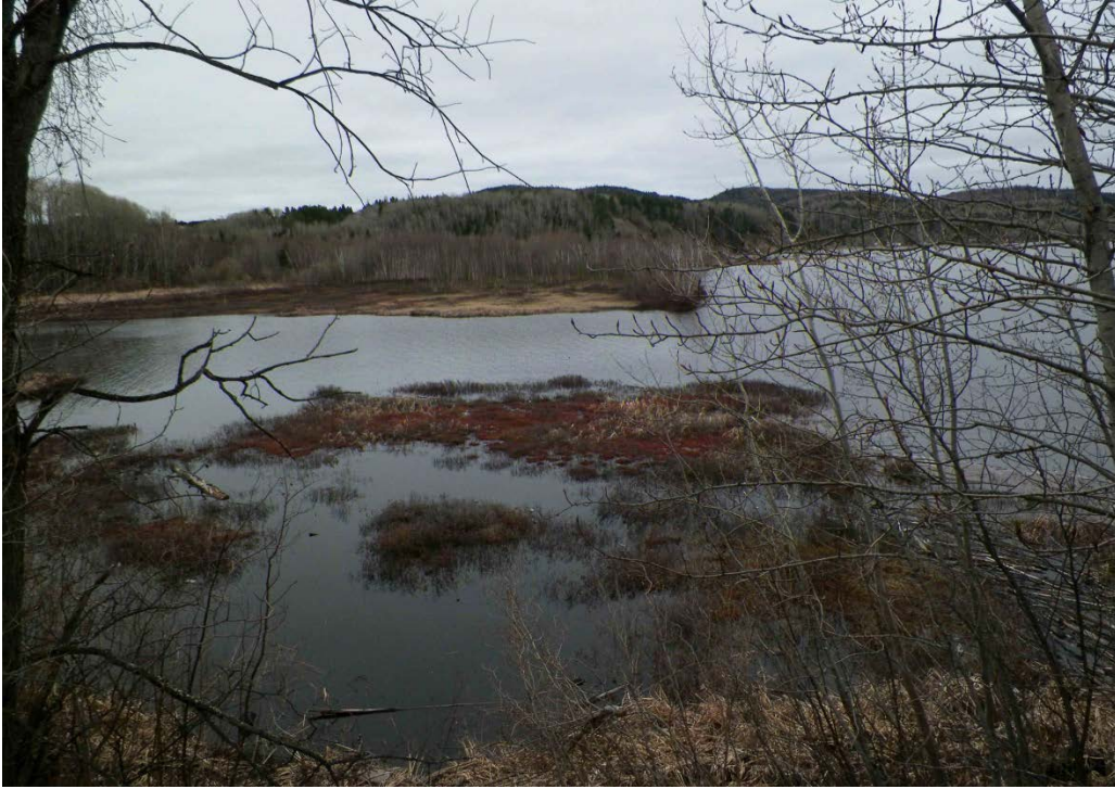
Figure 12 : Milieu humide situé près de l'embouchure de la rivière Métabetchouan. Latitude : 48,45218 N; Longitude : 71,95866 O. Niveau du lac : 13,16 pi.