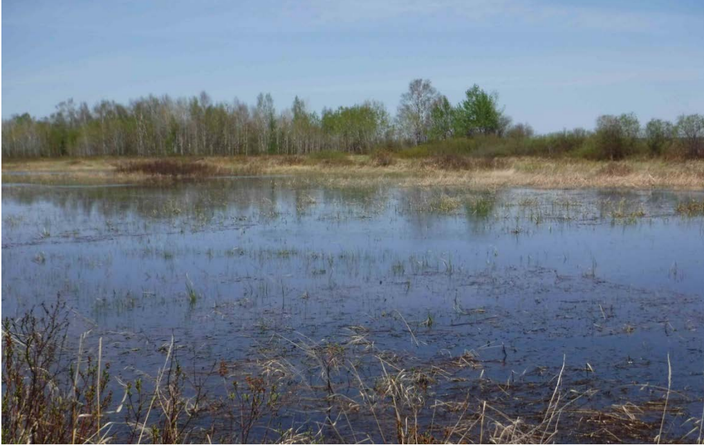
Figure 25 : Herbiers typiques retrouvés au sud du chemin du Bôme de Saint-Méthode, près de l'embouchure de la rivière Mistassini. Latitude : 48,71417 N; Longitude : 72,34386 O. Niveau du lac : 16,27 pi.