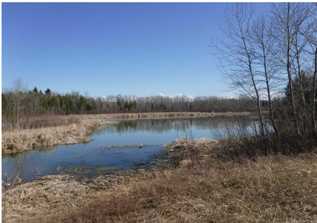
Figure 9 : Marais Le Rigolet. La vue est en direction du marais, à partir de la structure de maintien du niveau de l'eau. Latitude : 48,43690 N; Longitude : 71,86293 O. Niveau du lac : 14,00 pi.

Le marais Le Rigolet est classé comme ayant un potentiel de « faible » à « moyen » étant donné sa petite superficie, la faible diversité des herbiers et les problèmes entourant son accessibilité. Les précédents suivis réalisés à son embouchure ont d'ailleurs montré que peu de géniteurs accédaient au marais le printemps. La passe migratoire installée à l'embouchure, bien qu'elle puisse être franchie par les poissons, entrave possiblement leur déplacement vers le marais même lorsque le débit est adéquat.