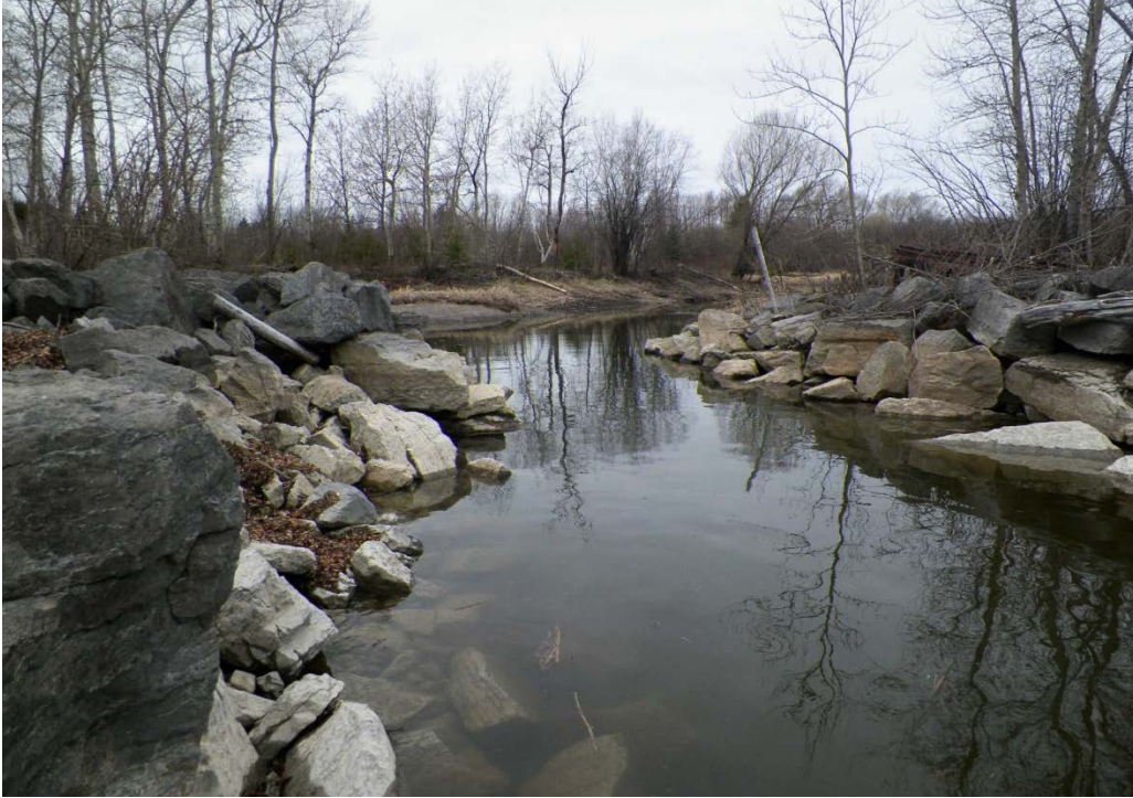
Figure 14 : Embouchure du ruisseau Pacaud. La vue est en direction de l'amont du ruisseau. Latitude : 48,45293 N; Longitude : 72,07474 O. Niveau du lac : 13,22 pi.