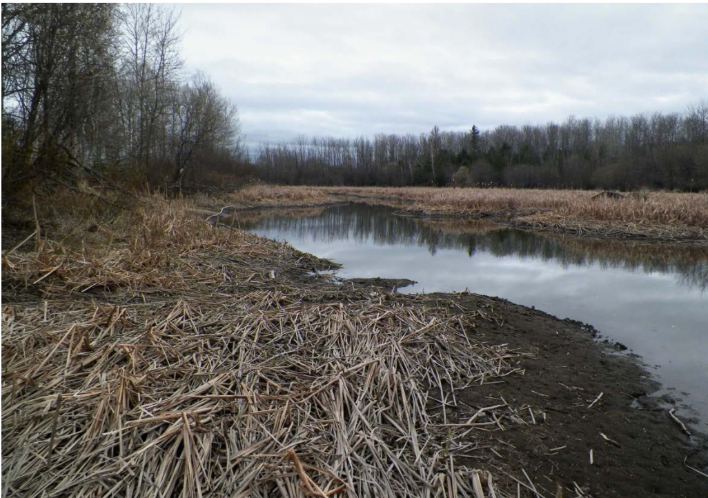
Figure 15 : Marais à l'embouchure du ruisseau Pacaud. La vue est en direction du ruisseau. Latitude : 48,45317 N; Longitude : 72,07571 O. Niveau du lac : 13,22 pi.