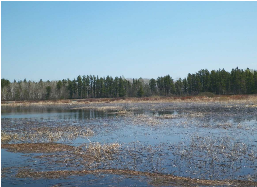
Figure 30 : Herbiers typiques retrouvés entre les îles de la rivière Mistassini. Niveau du lac : 16,44 pi.