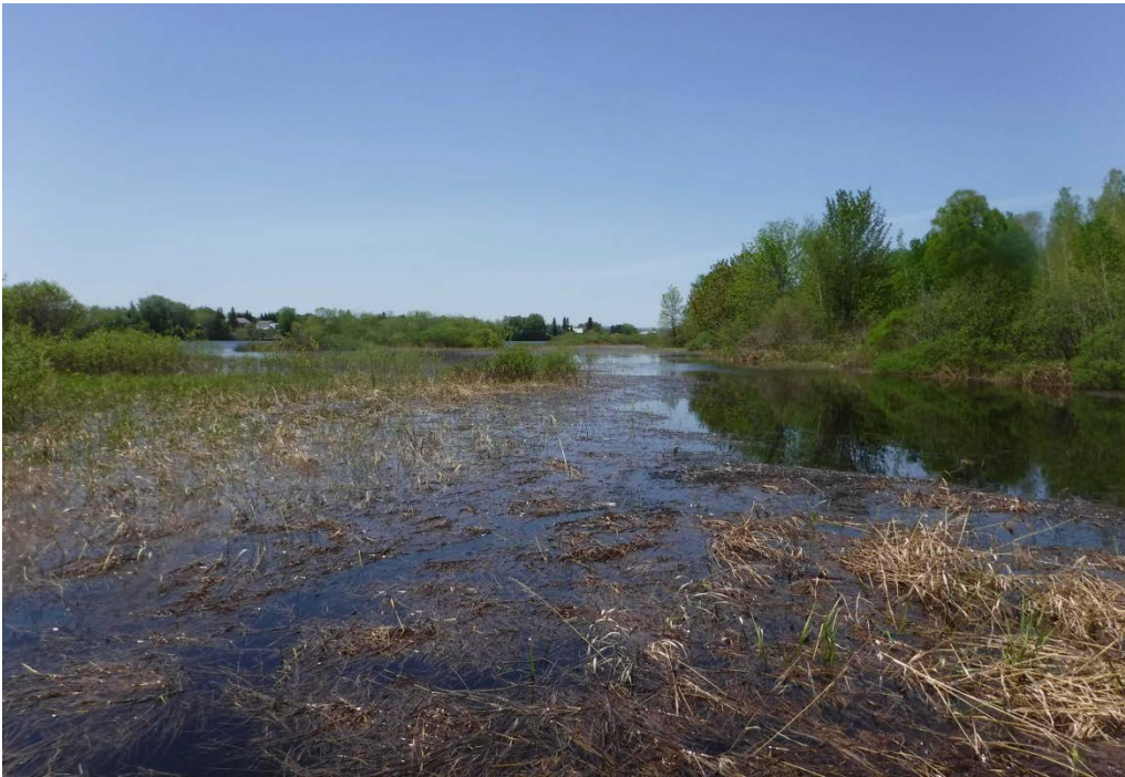
Figure 20 : Herbier typique des îles Hudon. Latitude : 48,64501 N; Longitude : 72,41227 O. Niveau du lac : 16,27 pi.