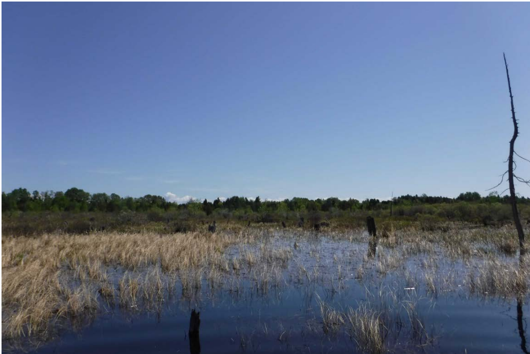
Figure 17 : Exemple de vastes herbiers inondés dans le bras Est des habitats de la baie Doré. Latitude : 48,45754 N; Longitude : 72,10978 O. Niveau du lac : 16,27 pi.