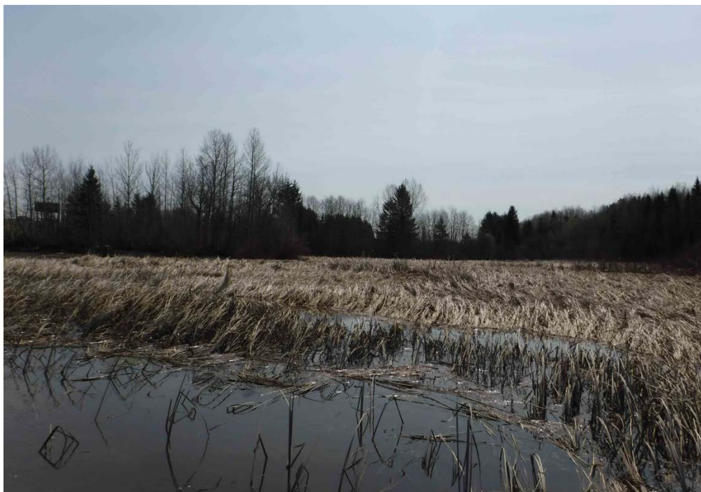
Figure 7 : Grand marais de Métabetchouan, herbiers près de l'embouchure de la Belle-rivière. Latitude : 48,45936 N; Longitude : 71,79147 O. Niveau du lac : 15,30 pi.