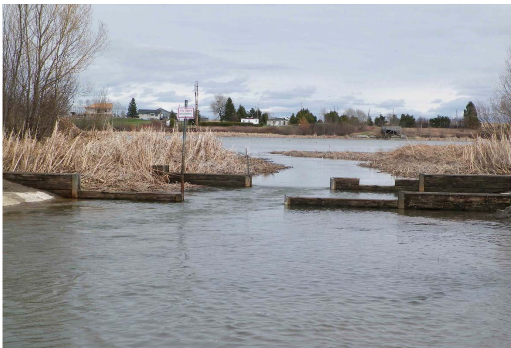
Figure 6 : Seuils à l'embouchure du Petit marais de Saint-Gédéon. Les deux structures amovibles sont absentes. La vue est en direction du marais. Latitude : 48,50344 N; Longitude : 71,77845 O. Niveau du lac : 13,22 pi.