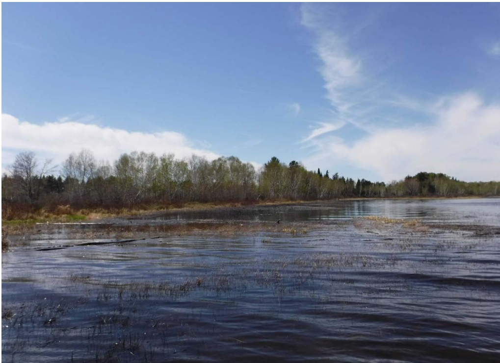
Figure 37 : Bras ouest du secteur de l'ancien lac Askeen. Niveau du lac : 16,50 pi.