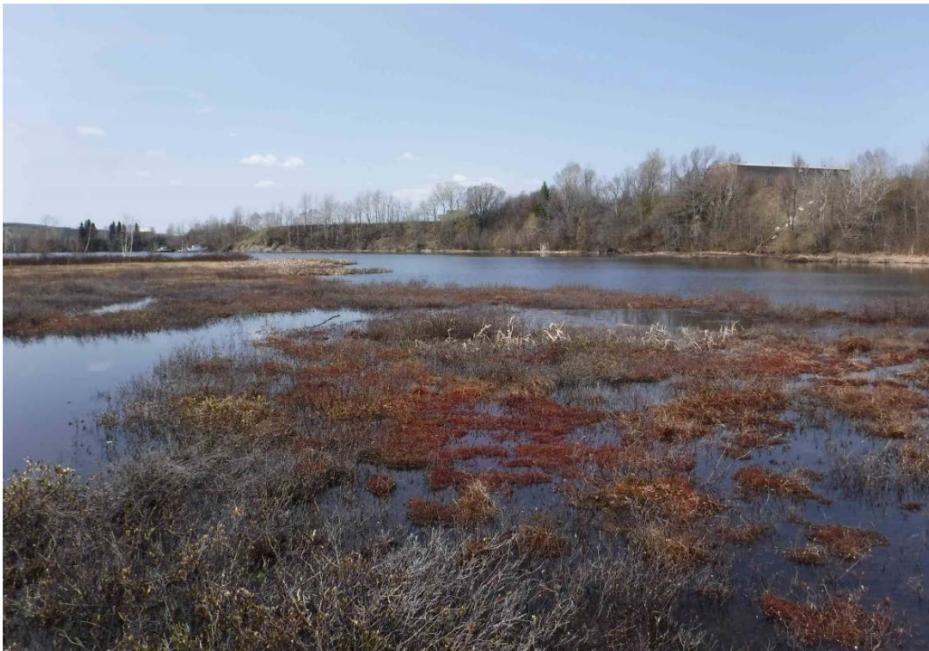
Figure 13 : Herbier typique retrouvé dans le milieu humide situé près de l'embouchure de la rivière Métabetchouan. Niveau du lac : 15,40 pi.