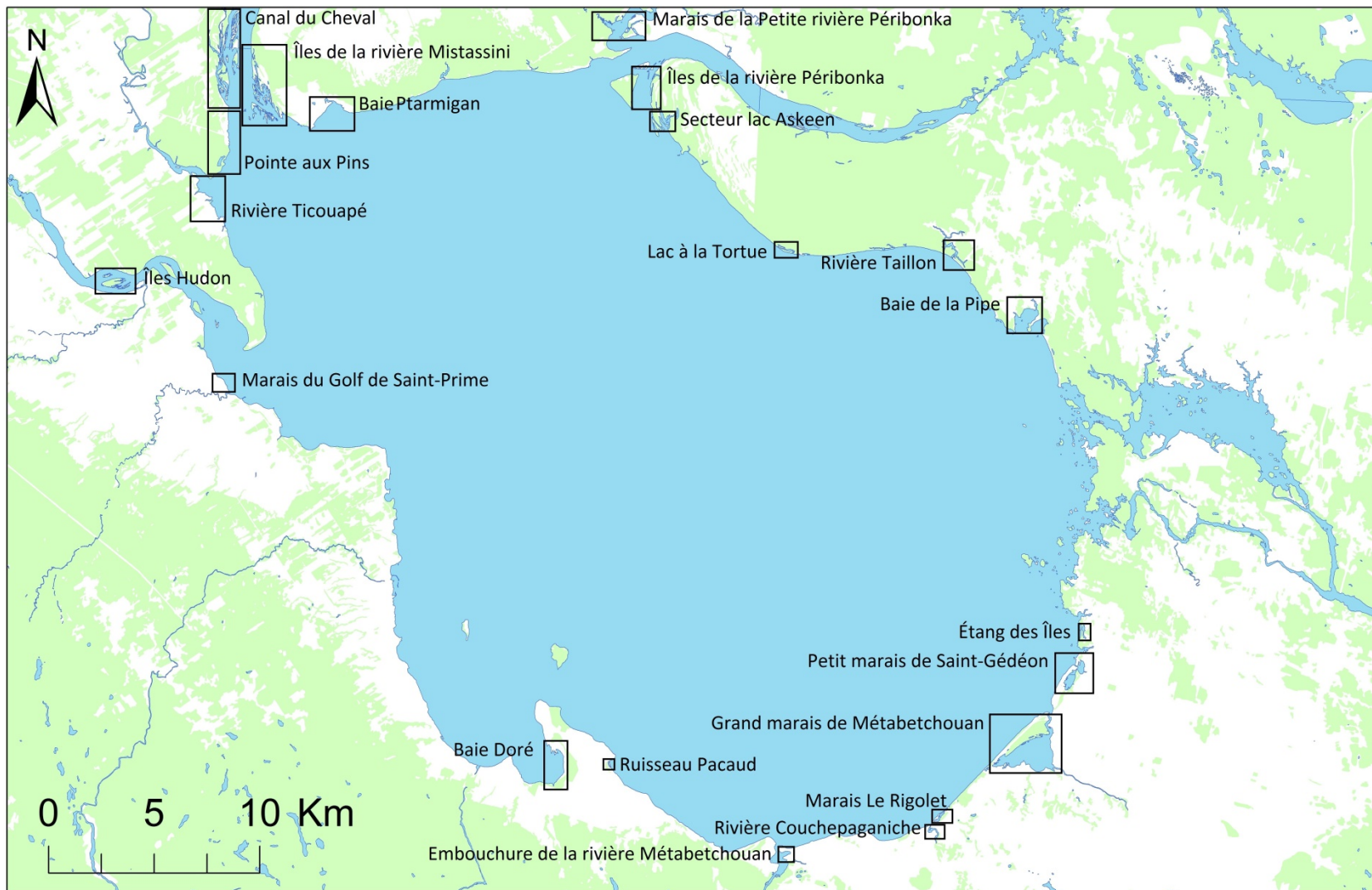
Figure 2 : Localisation des principaux milieux humides riverains visités au lac Saint-Jean au printemps 2016.