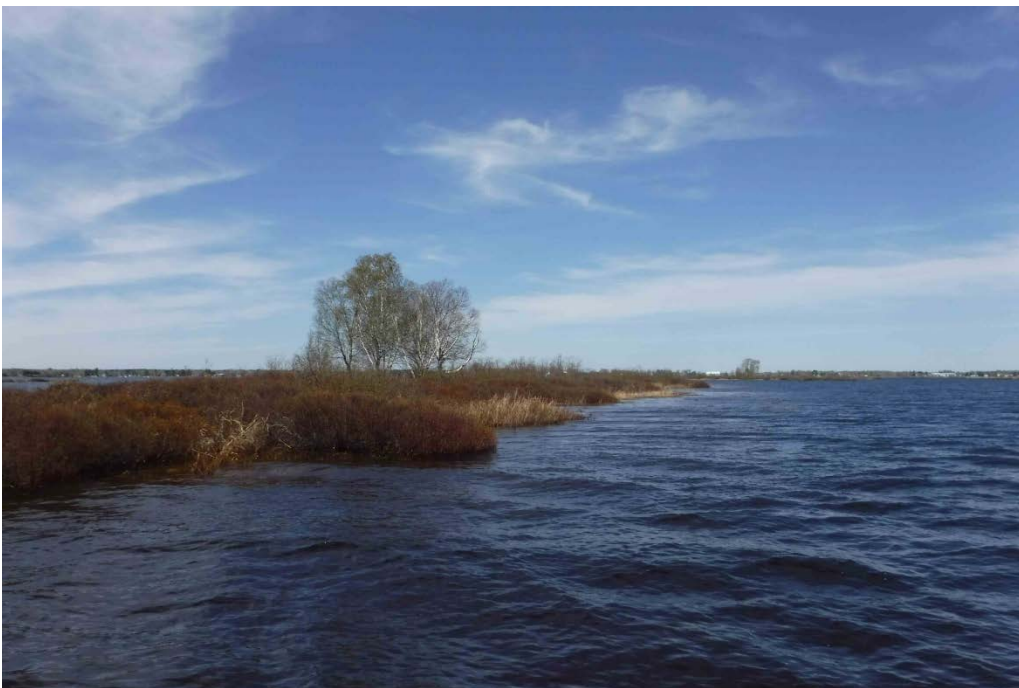
Figure 35 : Îles à l'embouchure de la rivière Péribonka, entre la Pointe-Taillon et l'île Bouliane. Latitude : 48,74612 N; Longitude : 72,07150 O. Niveau du lac : 16,50 pi.