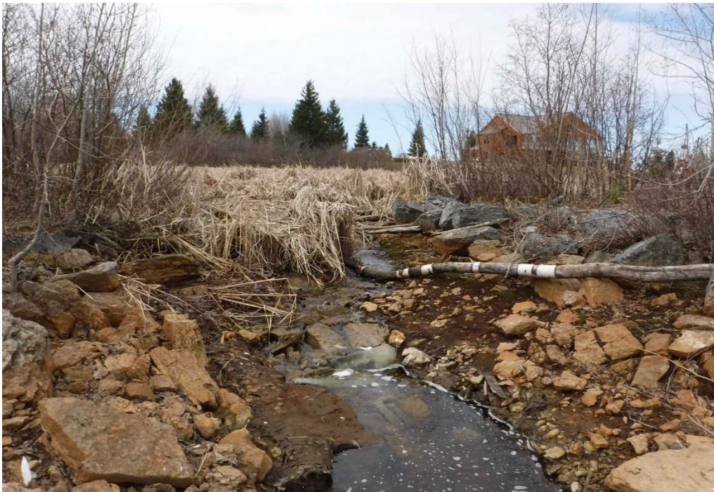
Figure 18 : Seuil à l'embouchure du marais du Golf de Saint-Prime. La vue est en direction du marais. Latitude : 48,60598 N; Longitude : 72,33518 O. Niveau du lac : 13,85 pi.

Le potentiel pour la fraie des poissons au marais du Golf de Saint-Prime est considéré comme « nul » puisque l'habitat est présentement inaccessible. Même si l'embouchure du marais était modifiée, la forte densité des herbiers de typhas fait en sorte que son potentiel demeurerait très faible, à moins de réaliser une restauration globale de l'habitat.