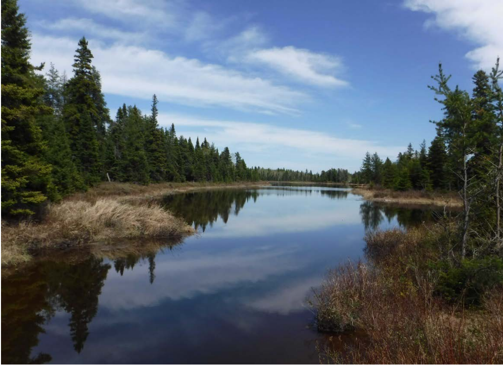
Figure 38 : Lac à la Tortue. La vue est en direction de l'habitat, à partir du seuil. Latitude : 48,67697 N; Longitude : 72,98127 O. Niveau du lac : 16,50 pi.